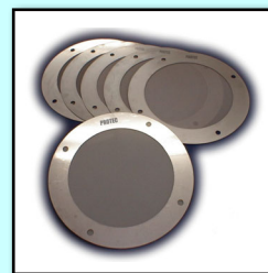
専用フィルター群 ※オプション品